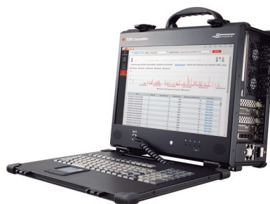
200Gポータブルモデル